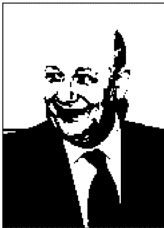
Il ministro Sandro Bondi

Il candidato sindaco ha illustrato al ministro la situazione di Reggio, conferman-